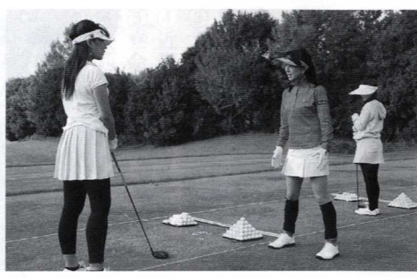
東尾プロのワンポイントレッスンが好評

会に寄付した。昨年同様に初心者を含めて幅広い層のレディースゴルフが楽しめるように、レベルに合わせたスルーラウンド、9ホールプレーと少人数制のレッスンを実施。今年も都内から往復バス送迎サービスを行い、参加者全員に乳がん無料検診券などのお土産