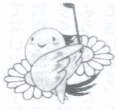
大会シンボルマーク

日程は11月16日(水)・17日(木)。プロの賞金総額は1500万円、優勝は300万円。2日間競技としてはシニアプロには美味しい話で、アマチュア選手たちと和気あいあいとした雰囲気の中にも、いつも力の入った戦いが繰り広げられる。季節もよく、熟練のシニアのプレーぶりはさんこうになるはずでギャラリー観戦に出かけてみることをお奨めしたい。