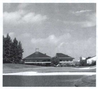
本戦が開催される「よみうりCC」

今年で第5回目を迎える兵庫県ゴルフ連盟が主催するビッグイベントの「2011年のじぎくオープンゴルフ選手権」決勝のアマチュア出場参加資格者が決定した。