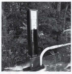
駐車場に設置したEV充電器

日産リーフの発売によりEV車(電気自動車)もいよいよ身近なものになり、全国各地で充電スタンドが着々と設置されている。そんななか関西のゴルフ場では恐らく初めてとなる、EV車対応の充電器(パナソニック製)が大府府島本町のベニカントリー倶楽部にお目見えし、9月から運用を開始した。