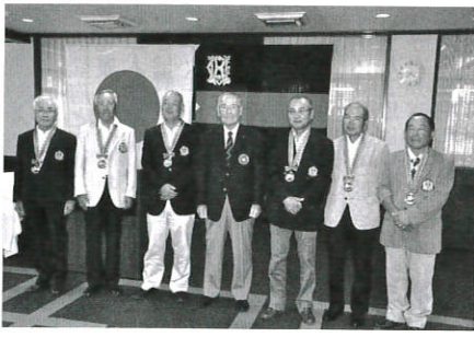
ロータリーGCチーム(中央はKGU三宮常務理事)

今回が第1回となる「オール関西クラブチーム対抗親睦ゴルフ大会」決勝が8月27日、茨木カントリー倶楽部西コースで開催された。この大会は関西ゴルフ連盟がゴルフ振興協力金支援事業のひとつとして開催されたもので、各地区予選を勝ち抜いたクラブ代表の全20チーム(1チーム6名)が出場