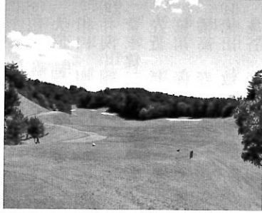
朝宮ゴルフコース

滋賀県甲賀市にある朝宮ゴルフコース(綾羽グループ)は、協賛会員の預託金を全額返還した上で、オリックス・ゴルフ・マネジメ